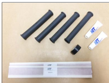
Principais componentes do kit

As emendas POJ são fornecidas em kits completos contendo todos os materiais para sua montagem e instruções detalhadas para sua correta instalação.